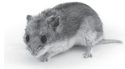
▼ Afb. 11 Chinese hamster.

Een niercel is een lichaamscel en bevat 22 chromosomen in de celkern.