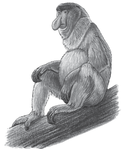
▼ Afb. 12 Neusaap.